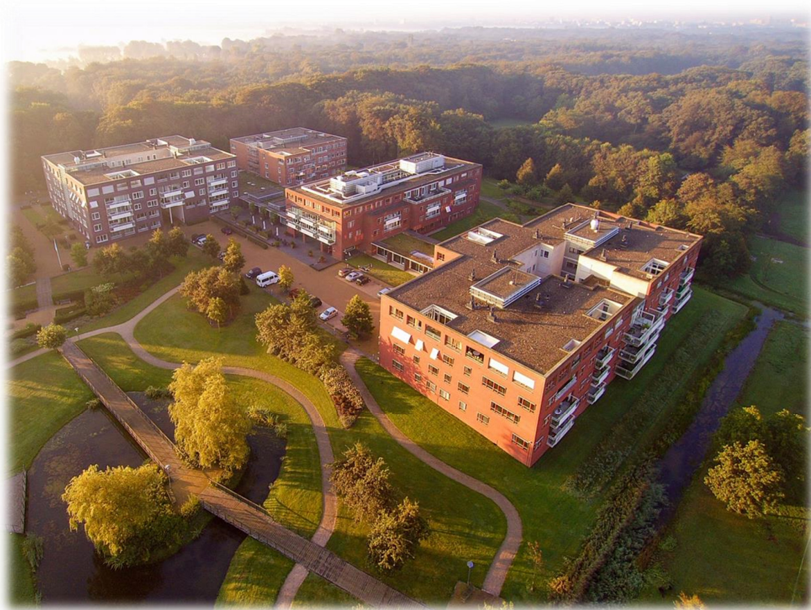
Stichting Johannahuis (middelste gebouw) in het Van Ommerenpark te Wassenaar